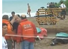
Drei Tote bei Blitzschlag am Strand