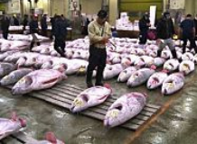
Größter Fischmarkt der Welt muss umziehen