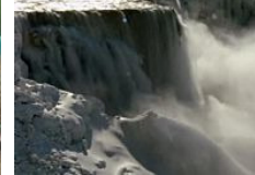
Spektakulär: Niagarafälle eingefroren