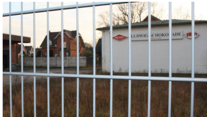
Auf dem Grundstück der ehemaligen Schokoladenfabrik wird vorerst nicht gebaut.

Die Verwaltung ist stinksauer: Der Johanniter-Regionalverband Hamburg hat die Pläne begraben, auf dem Gelände der ehemaligen Schokoladenfabrik am Justus-von-Liebig-Ring eine Privatschule zu bauen.